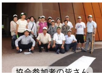
協会参加者の皆さん

次回は、平成29年8月30日に上田市の多目的ホール「サントムニール」で開催されます。