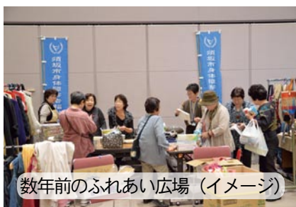
数年前のふれあい広場(イメージ)

を使い社協主催のふれあい広場が開催されます。協会からは女性部主体のバザーで参加をします。