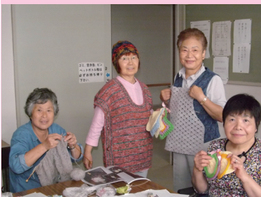
皆さんが着ているのも作品です