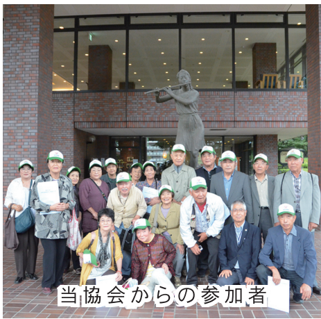
当協会からの参加者