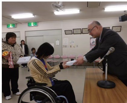
理事長より賞品を授与