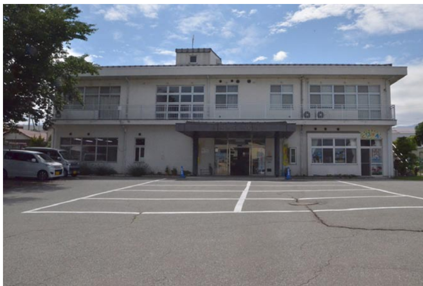
改装前の全景 (2020年6月23日撮影)

どに工事に入った。昭和61年（1986年）3月14日に完成した当福祉会館も年月により老朽化が進み、外壁塗装の全面塗り替え、屋根の塗装塗り替え、雨樋の交換、全トイレの全面改装、玄関ドア、水道管工事等、大掛かりな工事が行われることとなった。