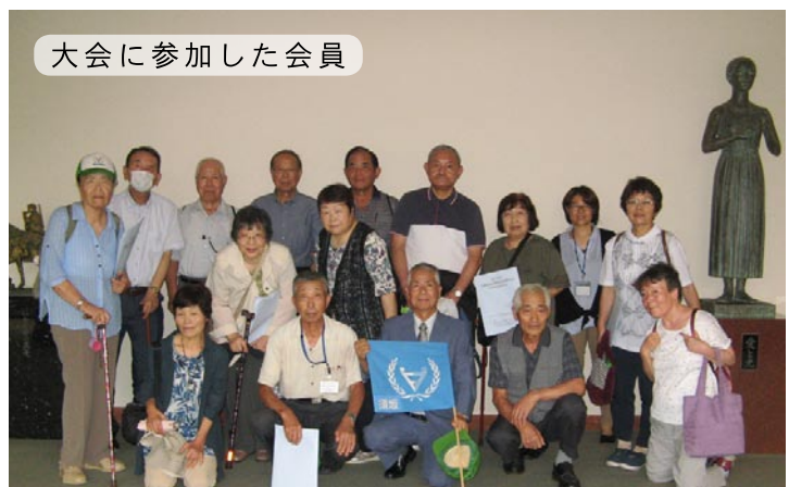
大会に参加した会員